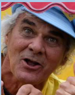
Alain HARIVEL Comédien Metteur en scène