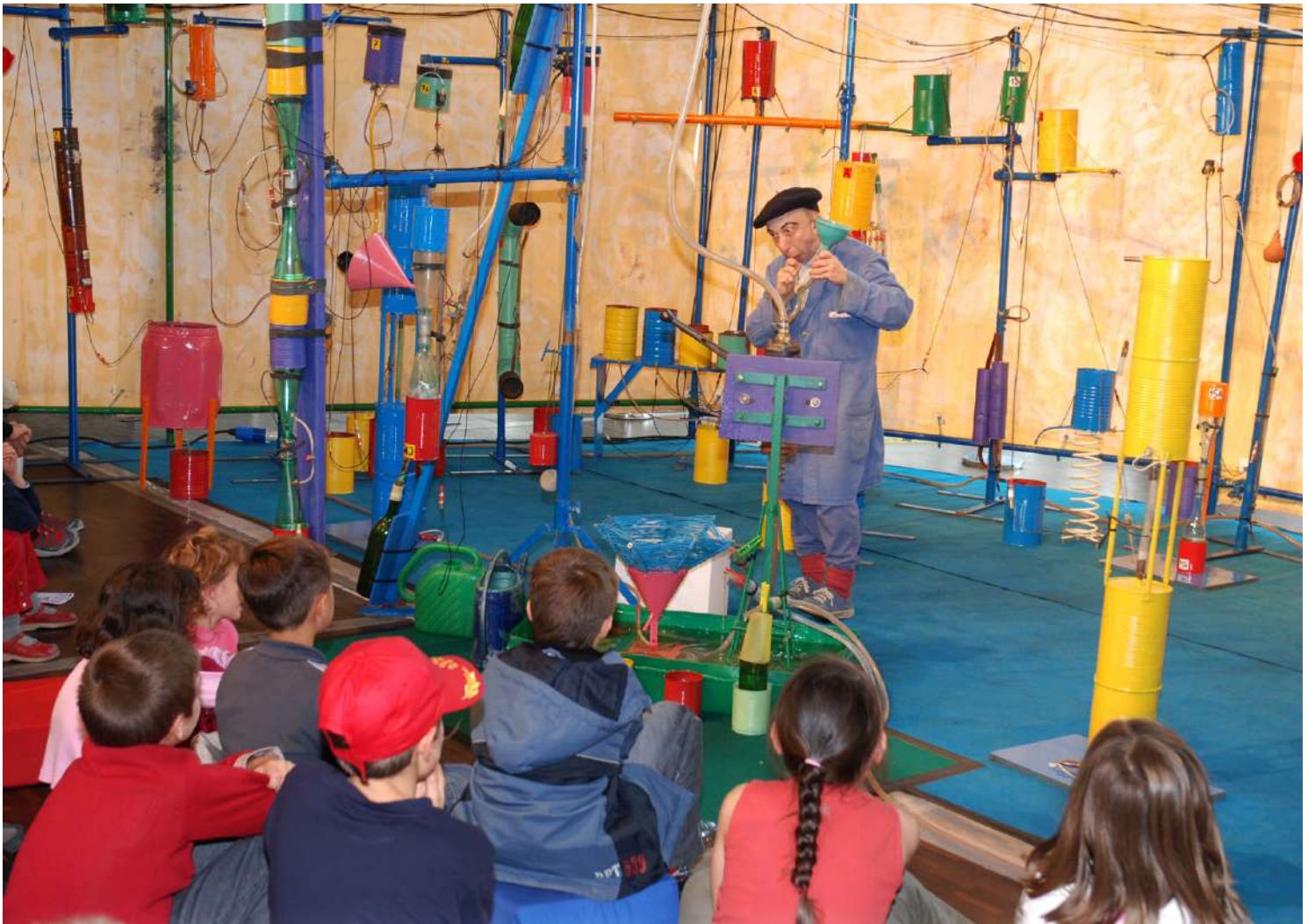
Concert Hydrophonique PHOTOS 2005